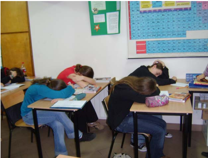
To musiała być bardzo ciekawa lekcja polskiego...☺