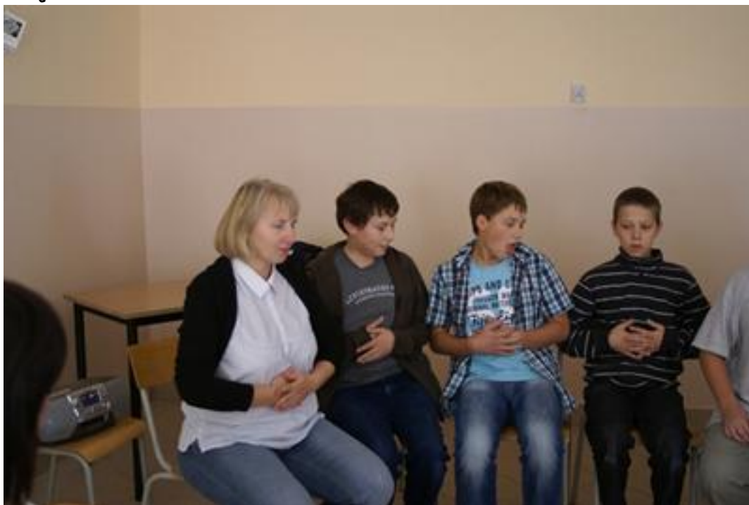
Chłopcy razem z panią oddychają przeponą

Bawimy się doskonale. Ćwiczymy dykcję, uczymy się oddychać przeponą..